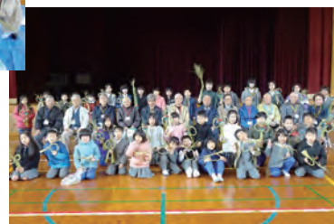
地域の高齢者の方に教えて いただき、お飾り作りをしました