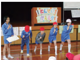
全学年で一年生の 歓迎をしました