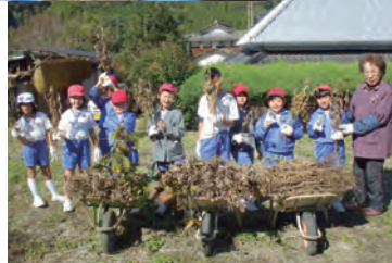
地域の方に教えていただきながら 全学年、栽培活動を行いました