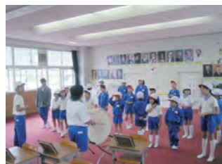
6年生を中心に考え 練習をしました