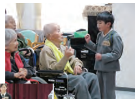
地域の老人ホーム を訪ねて交流を しました