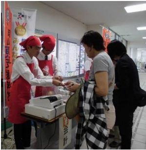
岡山市中区役所で 販売活動を行っています