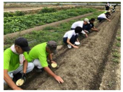
事業所の皆さんと一緒に 大根の種蒔きをしています

東岡山駅北に位置する本校は、平成9年に開校し、肢体不自由部門と知的障害部門の二つの部門に分かれています。知的障害部門高等部では、作業学習で製作した製品や収穫した農作物を、地域のご協力をいただきながら、さまざまな場所で販売学習を行っています。平成30年度からは、「福学連携モデル事業」にも取り組み、福祉事業所の方々と一緒に本校の実習地で農作業をしています。