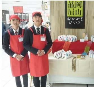
岡山轟眞に参加しています