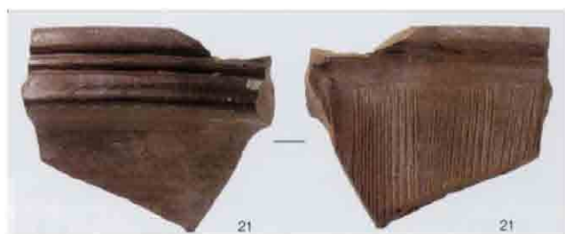
発掘調査出土国産磁器・陶器