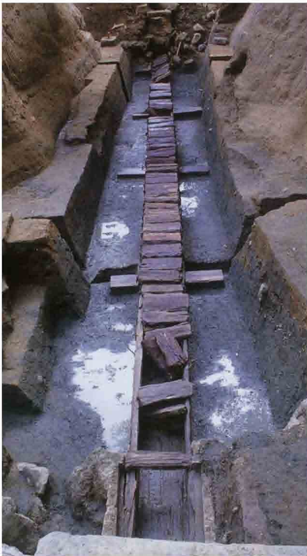
花交の池落樋木樋管全景（北から）