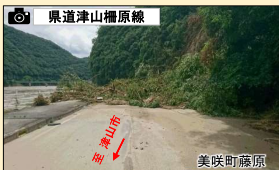
崩土で全面通行止