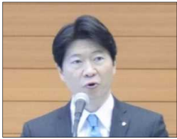
伊原木 岡山県知事