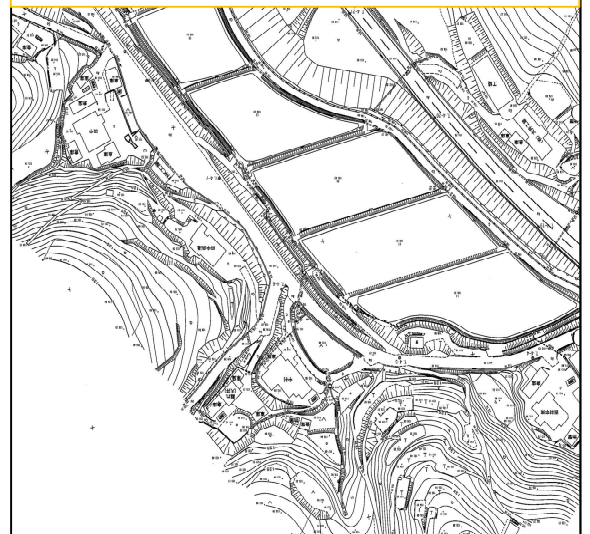
* 1/500で実測(イメージ図)