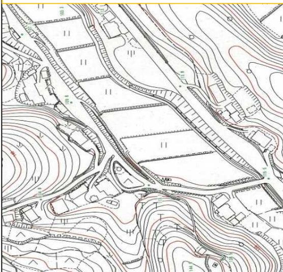
* 1/2500を右記図面範囲まで拡大(イメージ図)