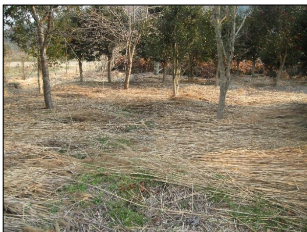
〈マルチング材として再利用〉