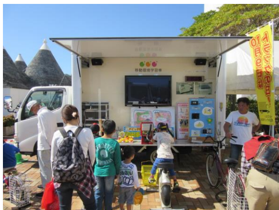
<環境学習出前講座>