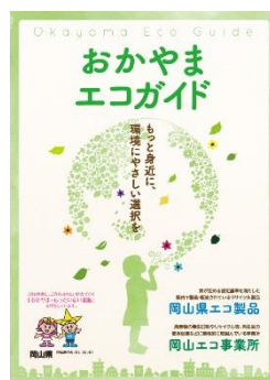
エコ製品・エコ事業所リスト