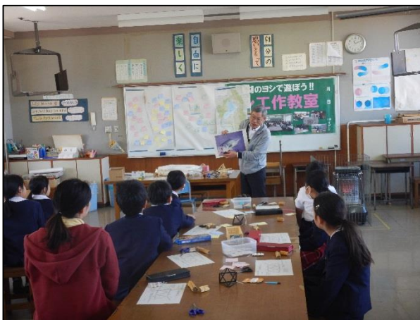
<ヨシの工作を行う大崎小学校の皆さん>