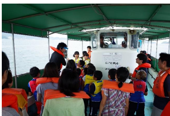
<児島湖・海コース> 児島湖クルーズ船内