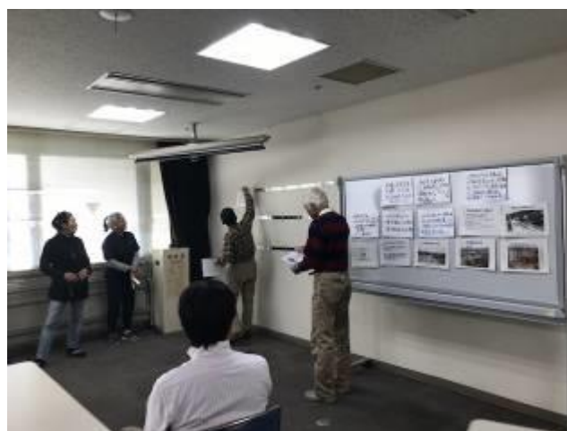
<推進員研修> 環境学習ツールの作成等