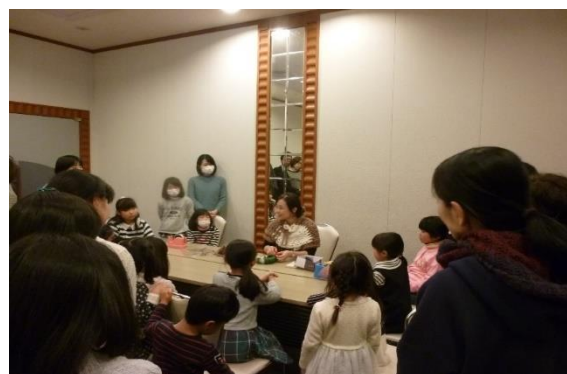
＜アースキーパーのつどい2017＞