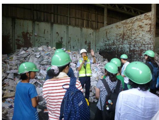
<リサイクル&エネルギーコース> 明和製紙原料(株)見学風景