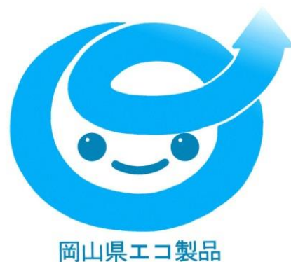
エコ製品認定マーク