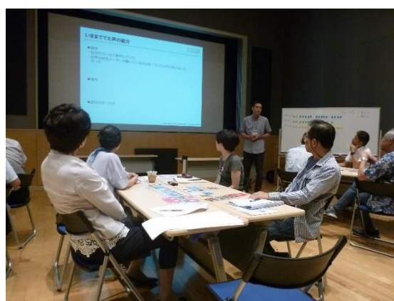
<おかやま環境教育ミーティング>