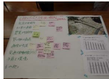
ワークショップでの成果