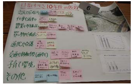
ワークショップでの成果