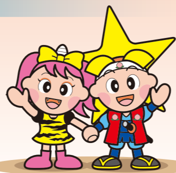
岡山県マスコット「ももっち」と「うらっち」

議事堂の工事をを行い、議会傍聴・委員会視聴の受付場所からエレベーターが直接ご利用いただけるようになりました。また、受付場所も広くなりましたので、傍聴・視聴にお気軽にお越しください。 (見取り図及び傍聴・視聴の手続きについて3面に記載しております。)