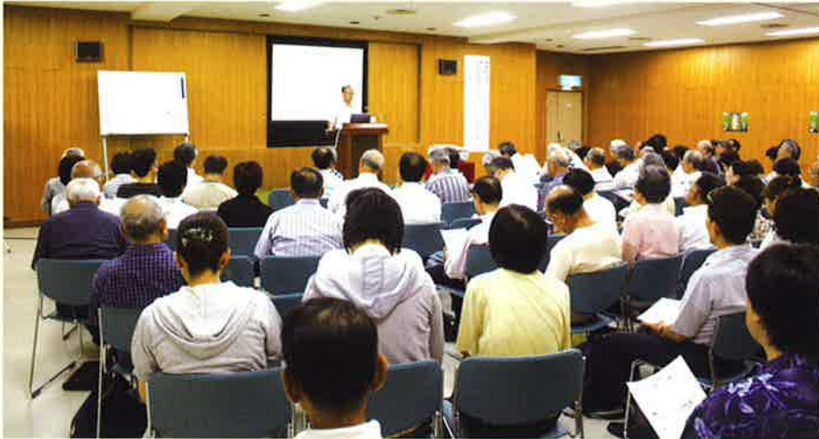
〈博物館講座スペシャルコースより〉