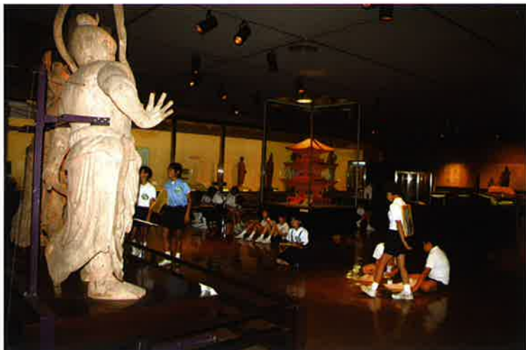
学校教育との連携

去る6月11日、ちょうど法律の施行日に東京で開催された「全国博物館長会議」で、文部科学省の担当者から法改正の概要について説明がありました。「法改正は不十分であり、今回の改正をきっかけとして検討を進め、時間をかけないでさらに改正を行いたい」と意気込みが示される一方、「国会審議の中で、衆議院では、社会教育法や図書館法については、活発な議論があったが、博物館法については一切質疑がなされなかった」という話も。「国会議員の関心がないことは、国民の興味や関心がないということ。ここ半世紀法律の改正がなかったのもわかる気がする」との自嘲気味の感想もありました。