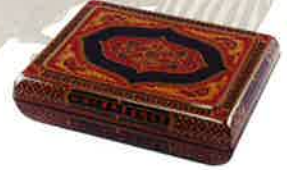
彩色蒔醬 御料紙硯匣 玉椿象谷 香川県立ミュージアム 蔵