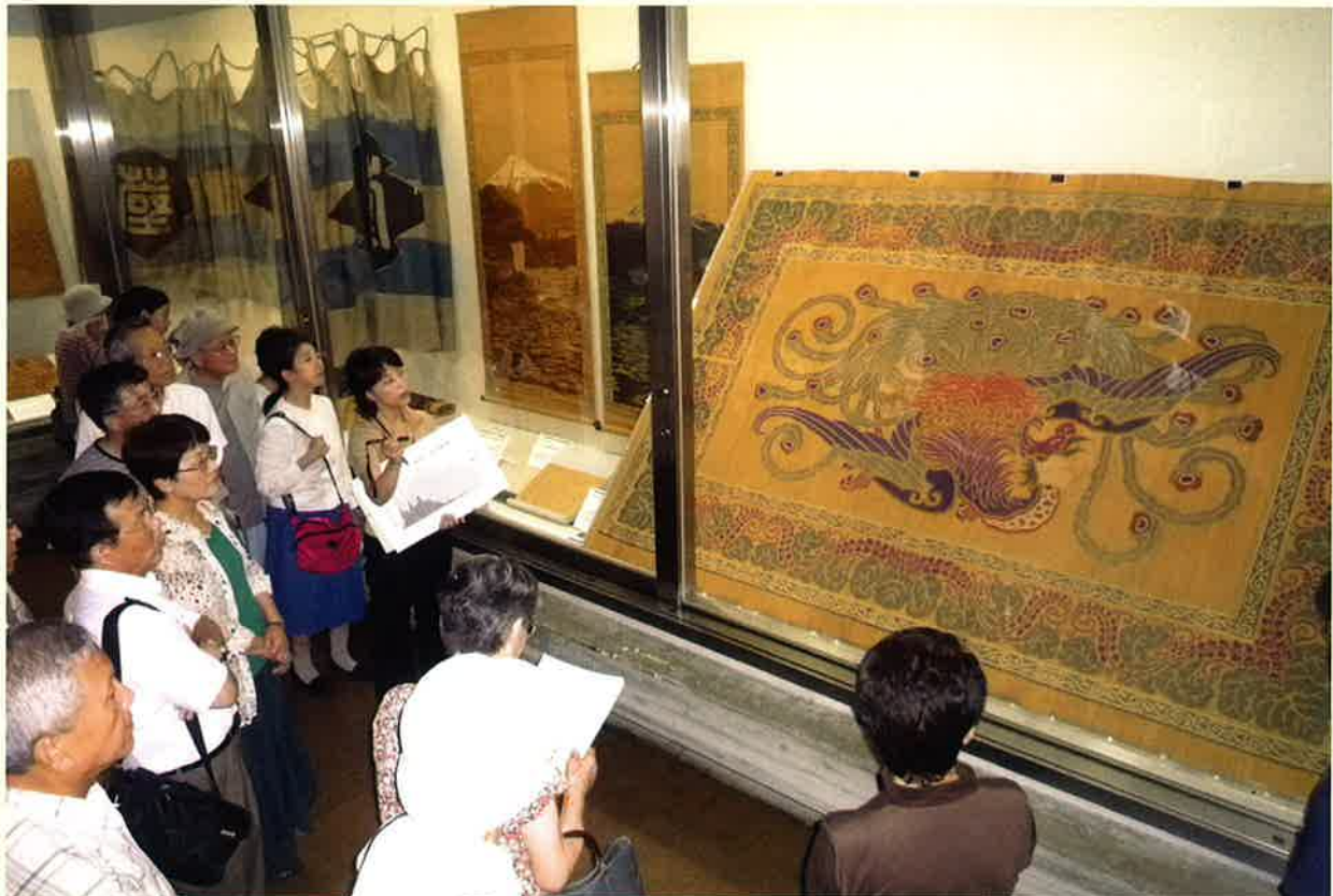
〈企画展より〉錦莞菴「桐輪廓鳳凰文」をみる