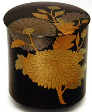
〈企画展より〉溜塗枝菊蒔絵曲水指