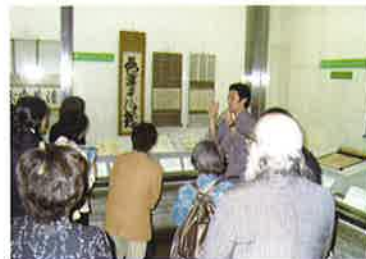
若宗匠による展示解説

本展では、京都家元の若宗匠に 3 回の展示解説をしていただき、毎回多くのお客様にお越しいただきました。また、茶の湯文化に親しんで