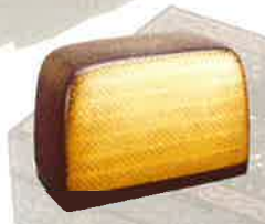
油漆漆箱「粧」 山口松太 倉敷市立美術館 蔵