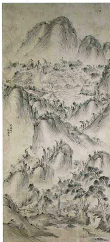
国指定重要文化財「閑谷学校関係資料」のうち閑谷学校図 文化11（1814）年 岡山県立博物館蔵