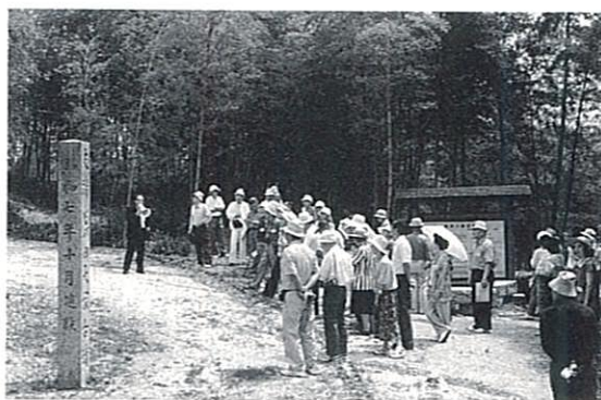
博物館講座現地見学 真備町 箭田大塚古墳