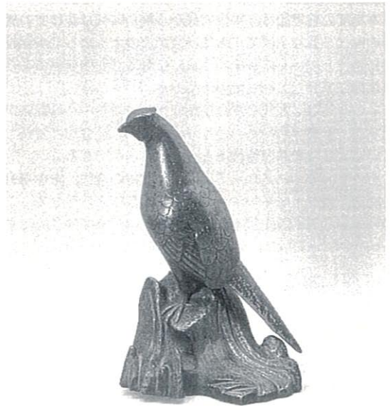
備前焼置物「雉」 江戸時代中期 総高30.0cm

明光山妙勝寺は、岡山に初めて日蓮宗を伝えた大覚が備前国へ日蓮宗を布教したとき、能勢氏に迎えられて一時とどまったといわれている寺院で、現在も岡山市船頭町にあるが、空襲で焼けたために古い資料は皆無という。