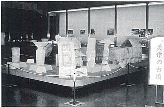
テーマ展 展示風景

古墳時代後半期の5世紀末から6世紀になると、木棺直葬や組合せ式箱形石棺を埋納した小規模な古墳が美作各地に築かれるようになる。こうした古墳の築造は首長から自立していく民衆の動向と深い係わりをもっていると考えられている。6世紀中頃に横穴式石室の築造が普及してくると、中小古墳の築造は爆発的ともいえる盛行をみせ、佐良山古墳群（津山市）のように200基もの古墳が群集して築かれたところも見られるようになる。こうした古墳築造の変遷とその有り様は、美作地方における政治的動向を反映するものであるといえる。古墳の築造は7世紀後半をもって終わりをつけるが、このテーマ展は、美作各地でこれまで学術調査や史跡指定・整備に伴う調査、各種開発に伴う調査等によって発掘された出土品のうち、主なものを集め、古墳時代における美作地方の社会や文化の一端を紹介したものである。