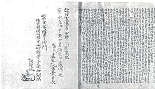
袖珍本「妙法蓮華経」8巻 室町時代末期 9.9×100~114cm