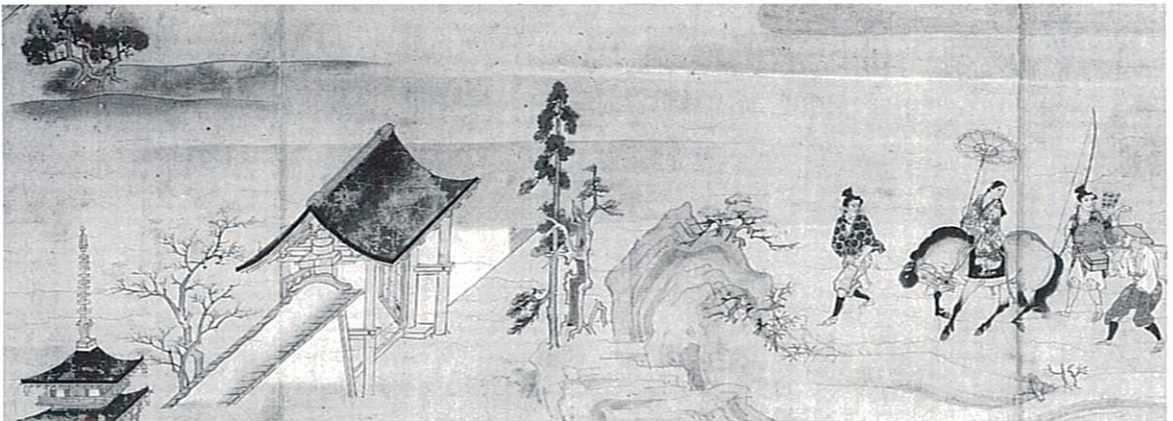
重要文化財 法然上人伝 東京都 増上寺