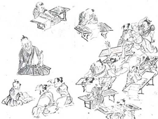
重文 一掃百態図 渡辺崋山筆 田原町教育委員会蔵

文化が、基本的に日常生活の上での生活技術と生活様式に根ざすものであることから、教育を高度な知的教育の問題におい小化することのないように配慮している。それは