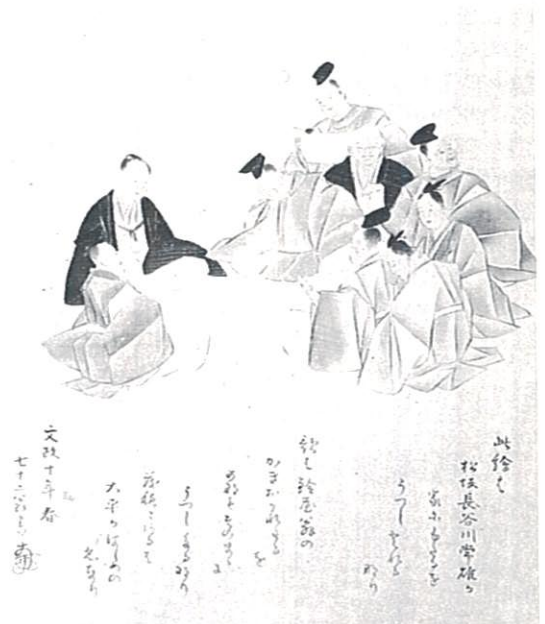
鈴屋円居の図 松阪・本居宣長記念館蔵

最後になりましたが、本展の開催にあたり、出陳を御快諾いただきました所蔵者の方々をはじめ、御協力を賜りました関係各位に心からお礼申し上げます。