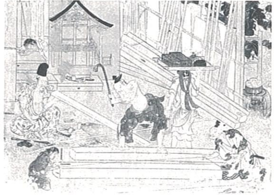
重文 職人尺絵屏風 川越・喜多院蔵

今日の複雑化した社会の組織構成と、発展分化した諸科学の実態が、日常的な市民生活にとって、しばしば無縁なものに見えようとも、文化こそ人間の生活の様式を規定し、