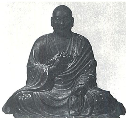
弘法大師坐像(六波羅蜜寺蔵)

昭和59年は、弘法大師が承和2年(835)3月21日、高野において入定(入滅)して以来、1150年目にあたる。これに因んで、本館では朝日新聞社との共催で、59年1月5日(木)から2月12日(日)までの間、『弘法大師と密教美術展』を開催する。この特別展は、昨年より京都国立博物館を皮切りに全国5会場を巡回してきたもので、今回の岡山が最終会場となる。出品される資料は、岡山県下はもとより、全国の真言宗寺院に伝来する大師ゆかりの宝物類や、平安・鎌倉時代の代表的な密教美術の名品など144件で、そのうち8割以上が国宝・重要文化財に指定されている。まさに密教美術の粋を集めて大師の偉業をしのぶ画期的な展覧会であり、今後これだけの逸品が一堂にそろふことは再びないと思われる。それ故、できるだけ多くの方々への御来館を得、会場内で展覧される広範な弘法大師の足跡と、深遠な密教美術の精華を通じて、我が国の文化への御理解を深めていただきたいと願う次第である。