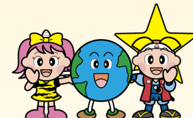
岡山県マスコット「ももっち」と「うらっち」