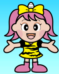
岡山県マスコット「うらっち」