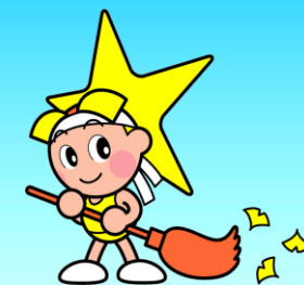
岡山県マスコット「ももっち」

「岡山県産業廃棄物処理税」は、循環型社会の構築を推進するため、3つの使途を柱として各種の事業に活用しています。