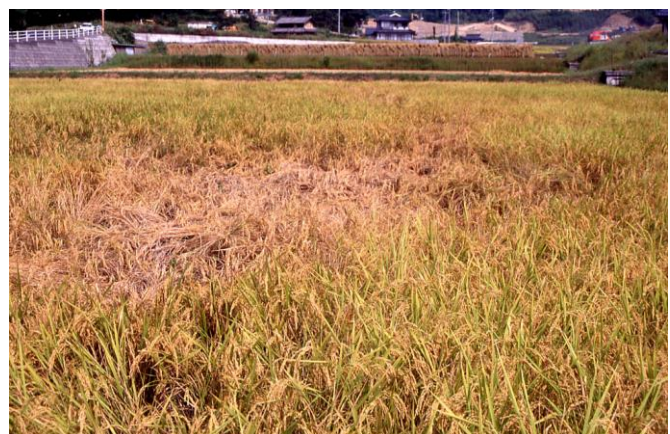
圃場の被害（坪枯れ）