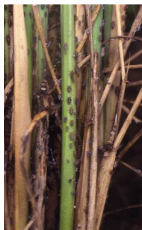
株元に集中して生息