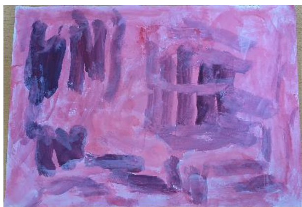
タイトル「ひまわり」