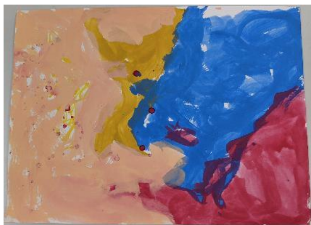
タイトル「ヒマワリと女性」