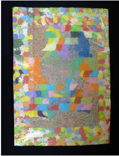
なごみの会 大原しのぶ様 河合宮子様 山本記代美様 渡辺睦様 他3名