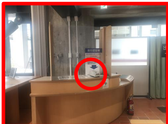
割引認証機① (県民室受付)