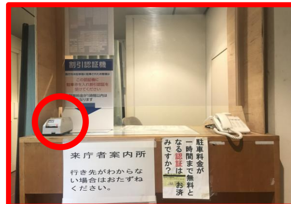
割引認証機② (西庁舎出入口守衛)