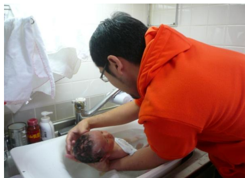
(写真) 男性社員の育児の様子

育児休業中の経済的支援制度（男女とも、育児休業最初の3ヶ月は基本給の半額を支援）を実施。また社内イントラネットにワーキングペアレンツ・ホームページ開設、男性育児休職者インタビューを掲載し、男性が育児休業を取得しやすい環境となるよう努めている。