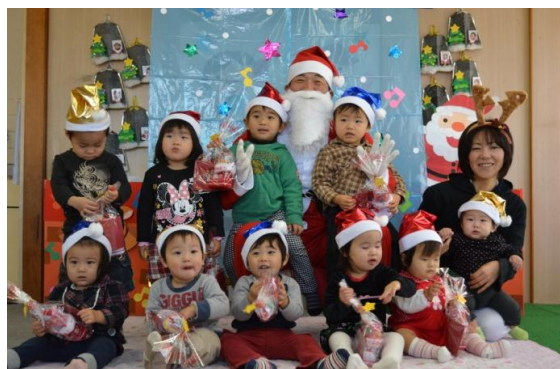
(写真) 院内保育所の様子