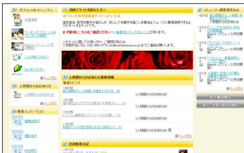
(画像) 育児休職者向けの専用ホームページ