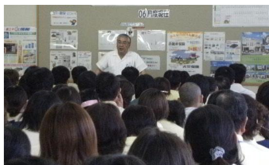
（写真） 社長による宣言の様子

社長が全従業員に対して、子育て支援に関する制度や環境を整備し、安心して働ける職場環境づくりに取り組むことを宣言した。