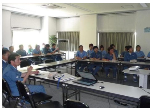
(写真) 「家族の日」の社内掲示及び管理職、監督職を対象とした説明会の様子