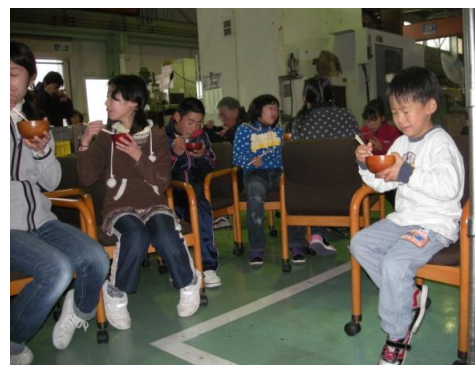
（写真）餅つき・門松づくり&ゲーム大会の様子