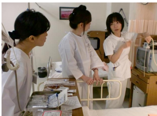
(写真) サポート研修の様子

結婚、出産等の事由で離職した看護師の職場復帰への支援として、平成20年1月から「サポート研修」を実施している。この研修は現在まで14回開催され、39人の参加者があった。その内7人が同院にて職場復帰をしている。