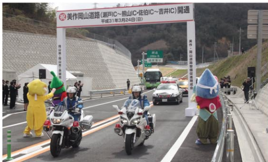
H31.3.24 瀬戸IC～熊山IC・佐伯IC～吉井IC開通

地域高規格道路美作岡山道路は、中国縦貫自動車道、山陽自動車道、中国横断自動車道岡山米子線と一体となって広域交通網を形成するとともに、美作圏域と岡山圏域の交流を促進し、地域の活性化に大きく寄与するものです。