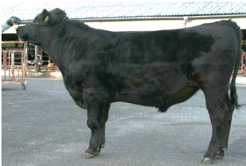
勝隼茂 (隼勝忠 - 百合茂 - 平茂勝)