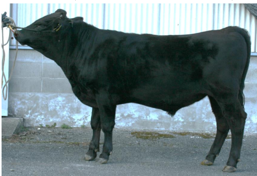
照秋姫 (福之姫 - 福安照 - 新初英)