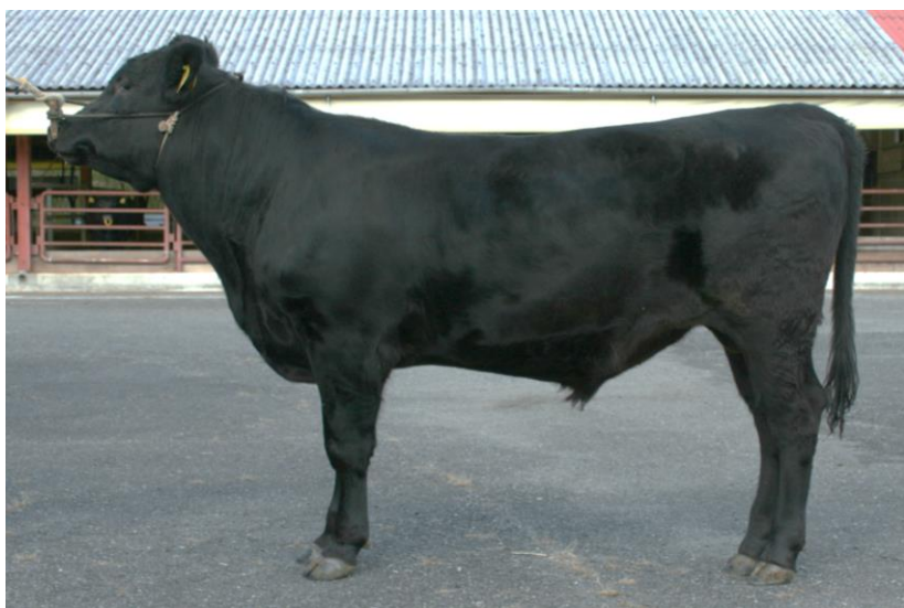
福美桜 (美国桜 - 百合白清2 - 福之国)