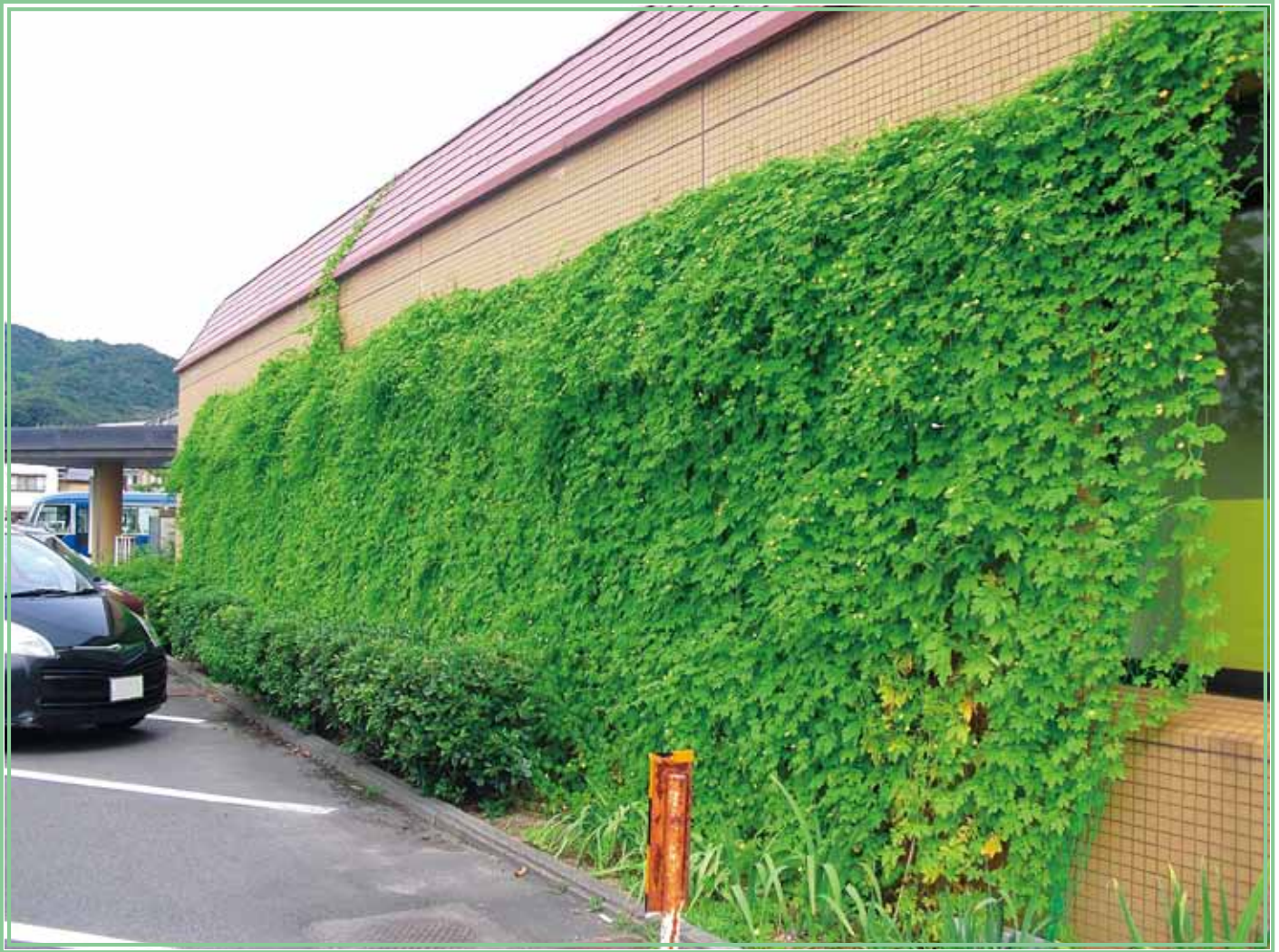
笠岡市社会福祉協議会

この広報誌は“ふるさとをきれいに する運動”を推進するために 配布しております。