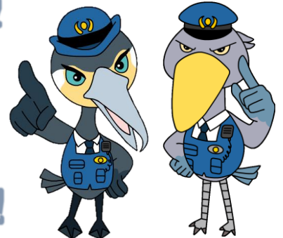
特殊詐欺被害防止キャラクター