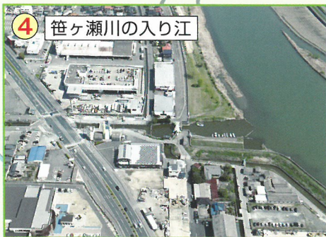
4 笹ヶ瀬川の入り江