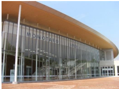
体育館 【桃太郎アリーナ】 (平成17年竣工)