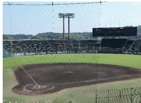
野球場 【マスカットスタジアム】 (平成7年竣工)