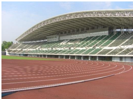
陸上競技場 【シティライトスタジアム】 (平成15年竣工)

岡山県総合グラウンド及び倉敷スポーツ公園の多くの施設が完成から10年以上経過し、公園施設の老朽化が進行しています。