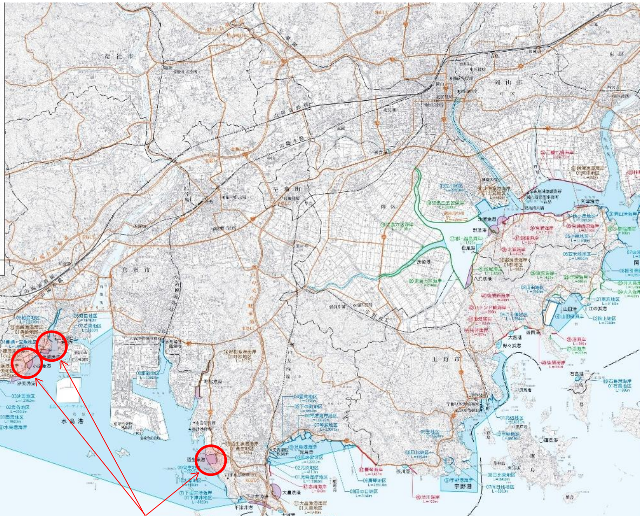
岡山沿岸漁港海岸(倉敷) 耐震性能照査 1式 耐震対策 1式