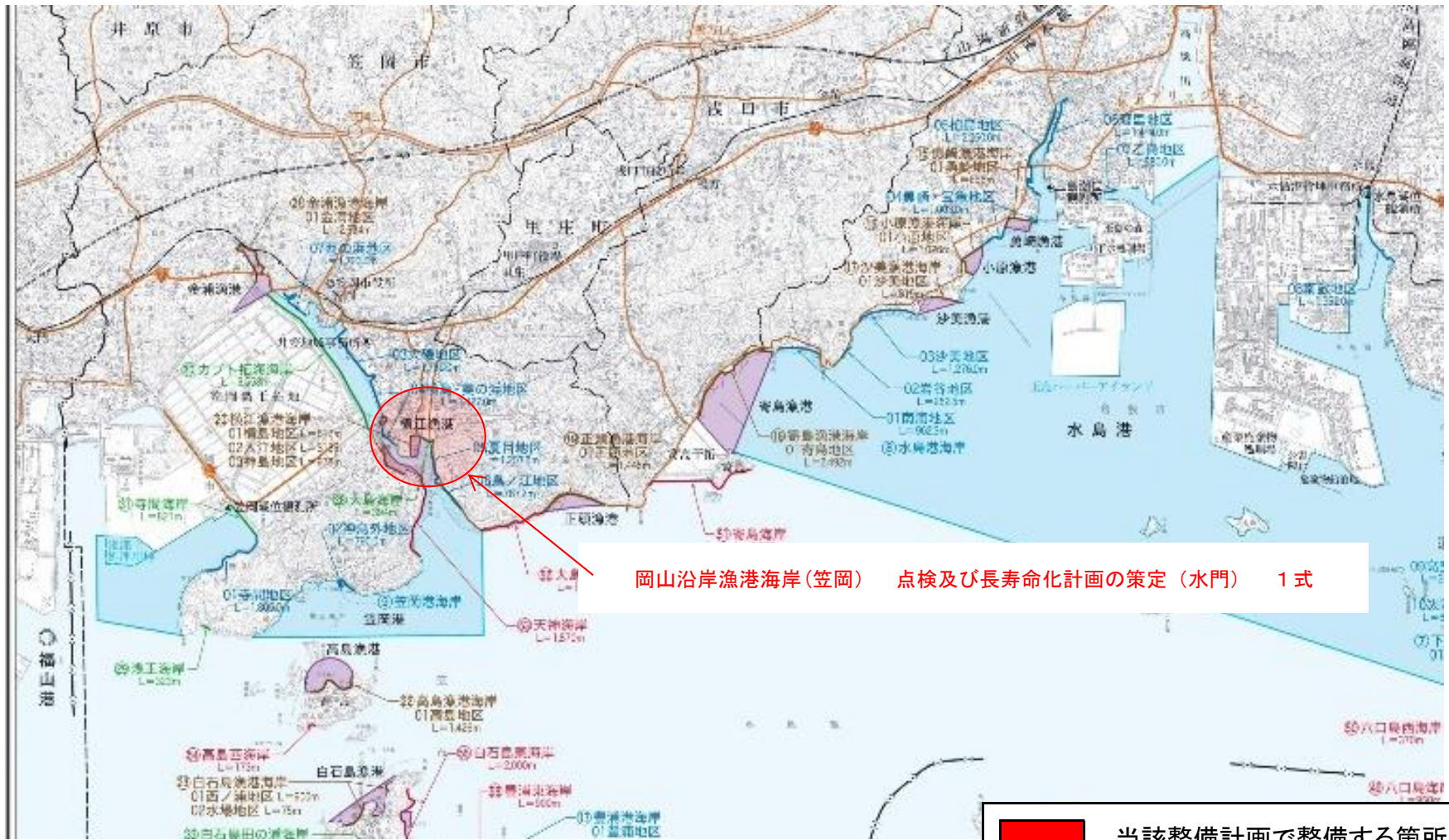
岡山沿岸漁港海岸(笠岡) 点検及び長寿命化計画の策定（水門） 1式