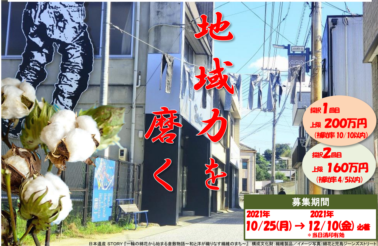
日本遺産 STORY『一輪の綿花から始まる倉敷物語～和と洋が織りなす繊維のまち～』構成文化財：繊維製品／イメージ写真：綿花と児島ジーンズストリート

岡山県備中県民局では、地域の諸課題を解決し、個性豊かで活力ある「生き生きおかやま」を実現するため、NPO、地域活動団体、ボランティア団体、企業など多様な主体と県民局との協働の取組として『提案型協働事業』を募集します。