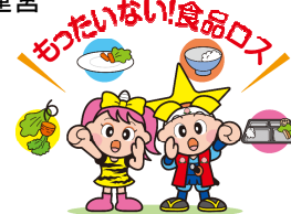
★「食品ロス」とは、まだ食べられるのに捨てられている食品のこと