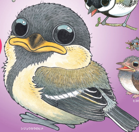
シジュウカラのヒナ