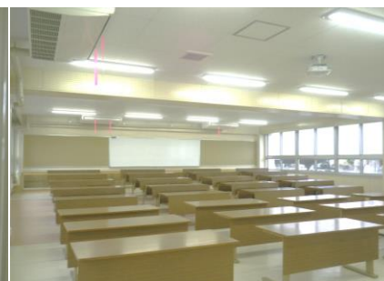
【建物内観(社会科教室)】