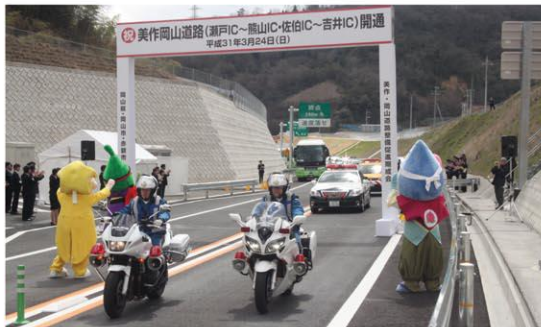
H31.3.24 瀬戸IC～熊山IC・佐伯IC～吉井IC開通

地域高規格道路美作岡山道路は、中国縦貫自動車道、山陽自動車道、中国横断自動車道岡山米子線と一体となって広域交通網を形成するとともに、美作圏域と岡山圏域の交流を促進し、地域の活性化に大きく寄与するものです。