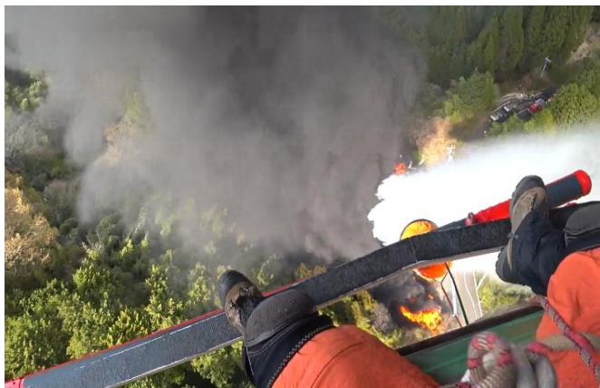
林野火災 真庭市 (令和3年4月4日)