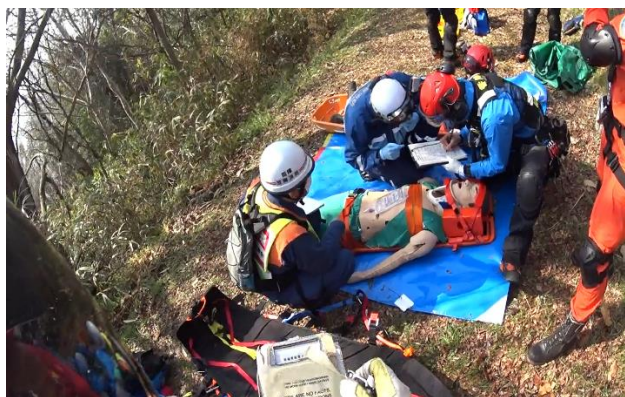
笠岡地区消防組合消防本部・香川県防災航空隊連携訓練