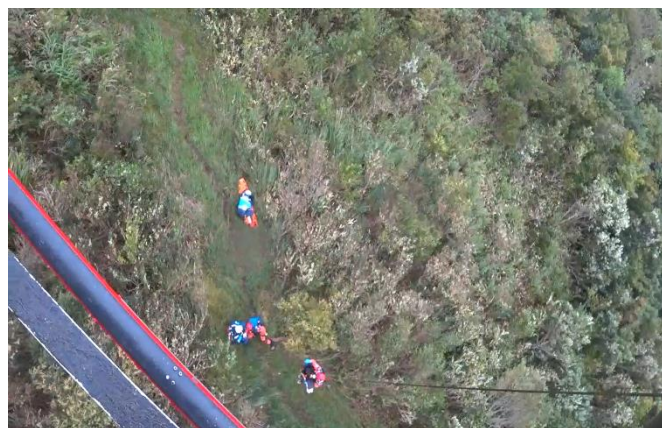
山岳救助 苫田郡鏡野町 (令和3年9月26日)