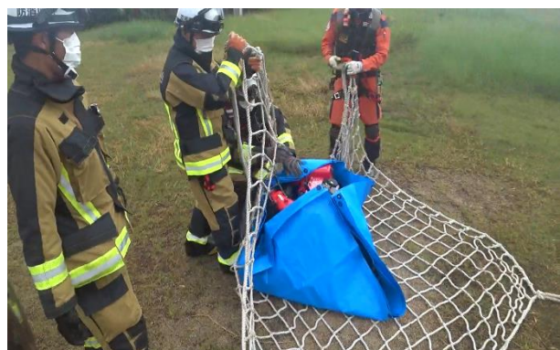
井原地区消防組合消防本部訓練