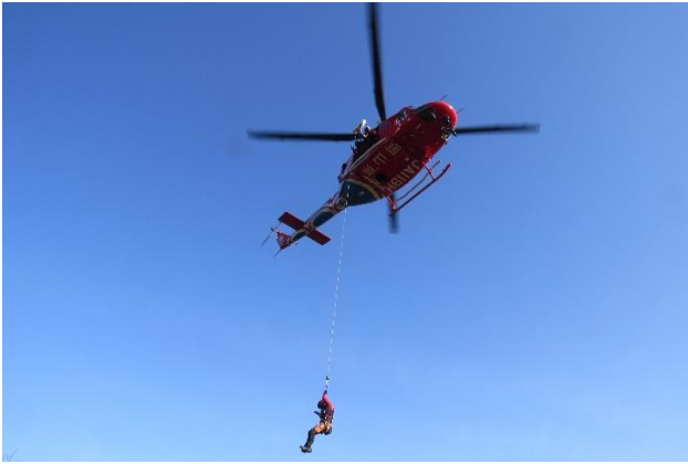
救助訓練（残土センター）