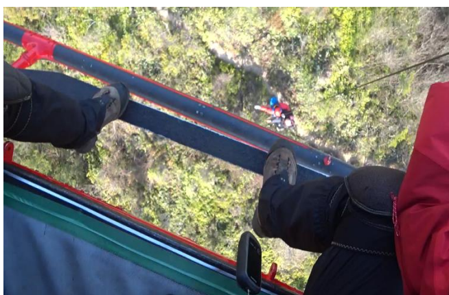
山岳救助 山口県 (令和4年1月9日)