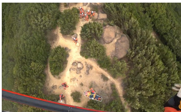
玉野市消防本部連携訓練