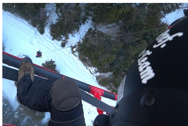
山岳救助 勝田郡奈義町 (令和4年1月2日)