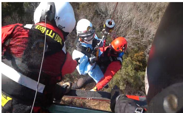
赤磐市消防本部連携訓練