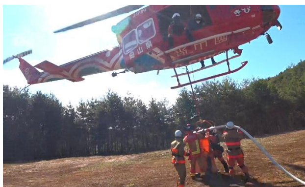
高梁市消防本部連携訓練