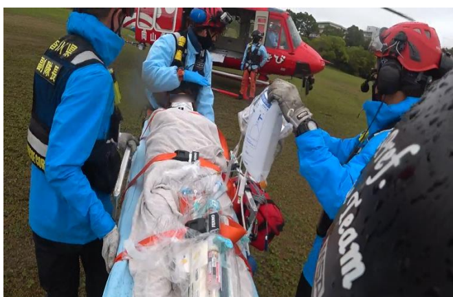
転院搬送 香川県 (令和3年7月1日)