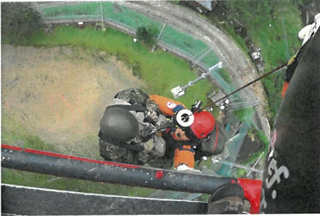
令和2年7月豪雨災害 熊本県 (令和2年7月4日～令和2年7月14日)