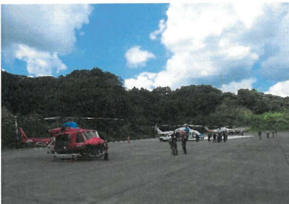
中国五県連携訓練