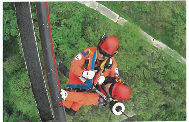
救助訓練（残土センター）