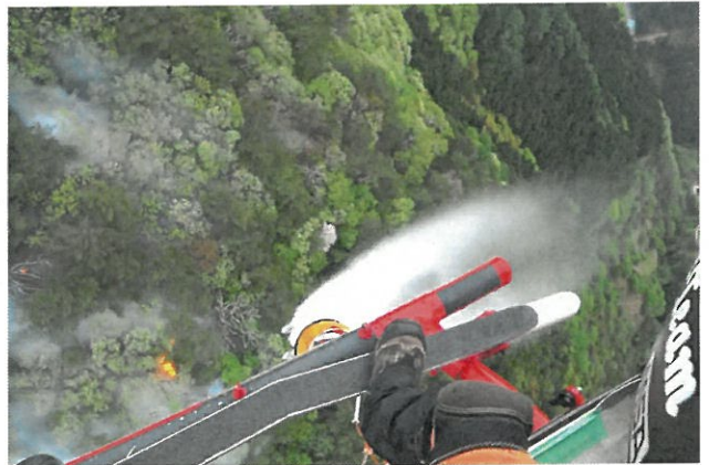
林野火災 兵庫県 （令和2年5月9日）