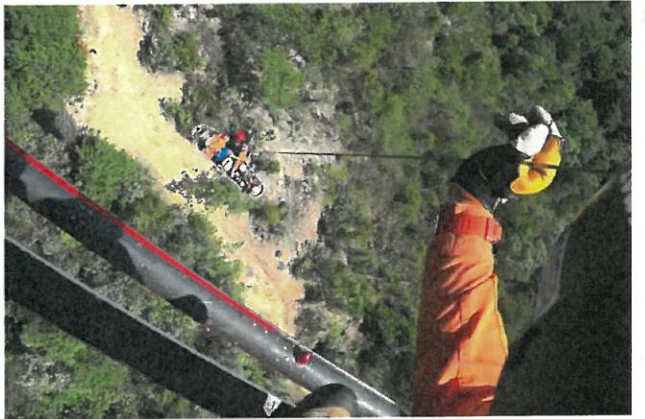
山岳救助 総社市 (令和2年9月21日)