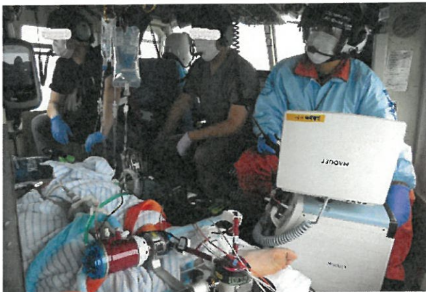
転院搬送 山口県 （令和2年6月6日）