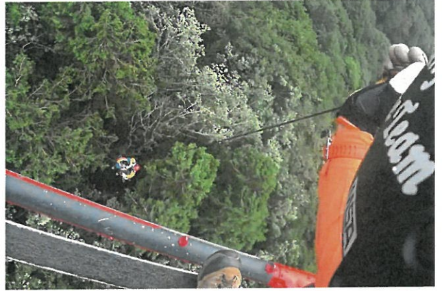
山岳救助 真庭市 (令和2年7月25日)