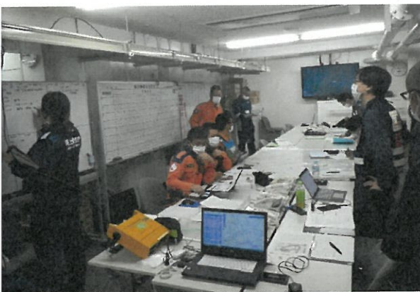
岡山県航空運用調整会議に伴う連携訓練