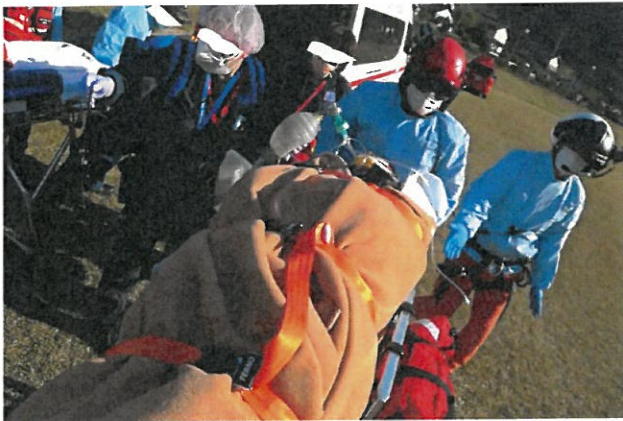
救急搬送（ドクヘリの運航） 高梁市 （令和2年4月24日）