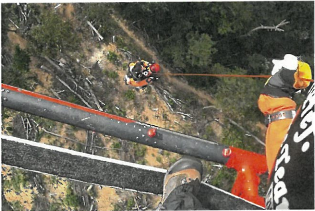
山岳救助 島根県 (令和2年8月15日)