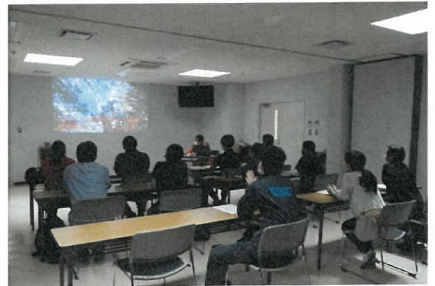
岡山県ドクターヘリスタッフ視察研修