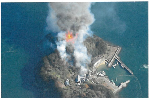
建物火災 倉敷市 (令和2年12月21日)