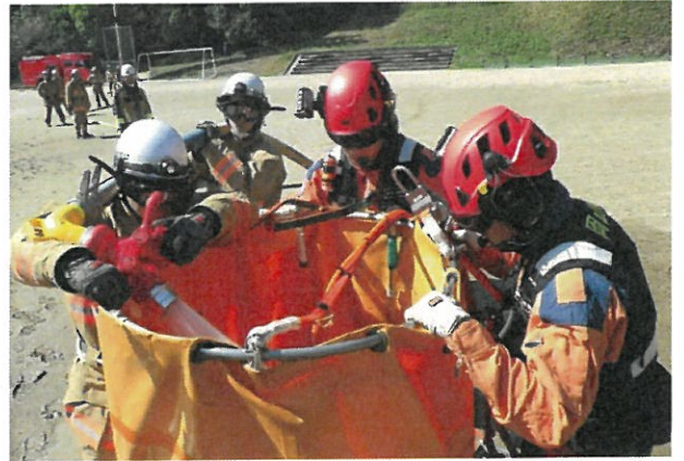
井原市消防本部連携訓練