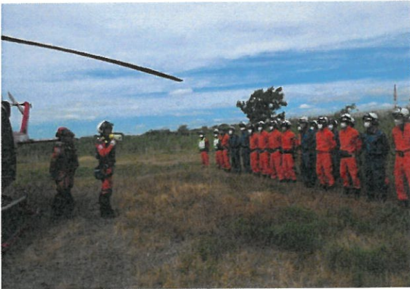
倉敷市消防局連携訓練