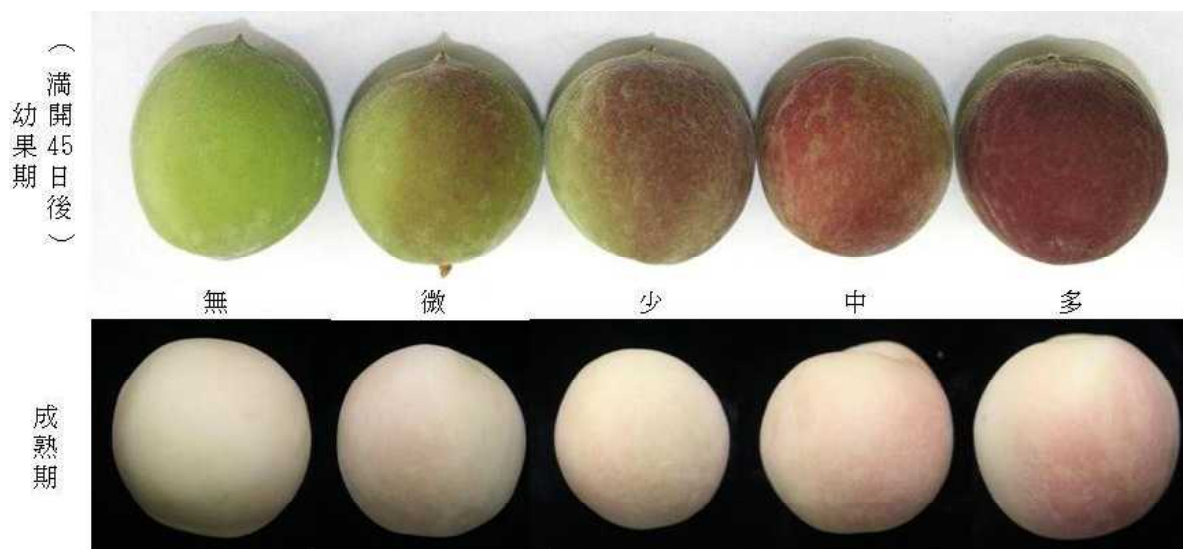
図1 幼果期の着色程度と成熟期の斑状着色程度