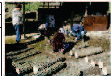
伐採木への植菌作業