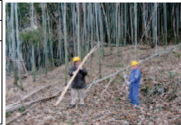
枯竹の伐採搬出作業