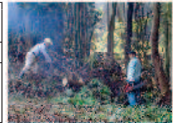
丁山の林内整備活動