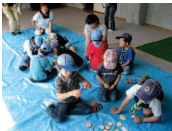
ボーイスカウト (木工教室)