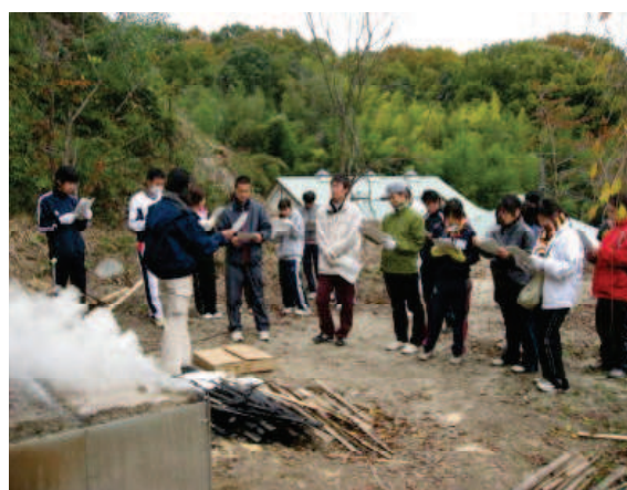
教職員初任者 (竹炭づくり体験)