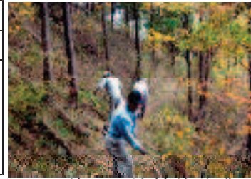
登山道の維持補修作業