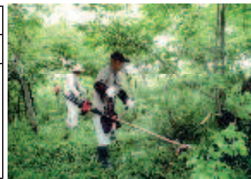
ケヤキの純林の下刈作業