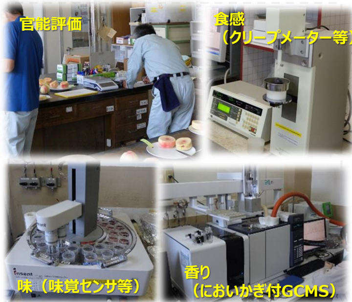
官能評価値と機器分析値を用いて、味、食感、香りを数値化する手法を開発しました