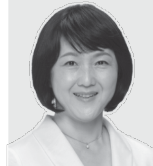
前衆院議員 梅村 さえこ 新 55歳。元消費税率をなくす全国の会事務局長。 活動地域 埼玉、茨城、栃木、群馬