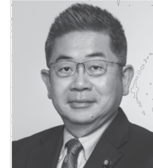
党書記局長 小池 晃 現 59歳。参院議員3期。全国革新総代表世話人。医師。 活動地域 東京