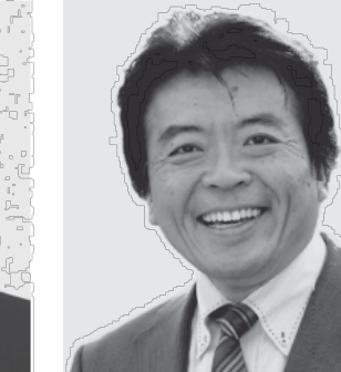
弁護士 仁比 そうへい 現 55歳。参院議員2期。党参院国対副委員長。 活動地域 中国、四国、九州・沖縄