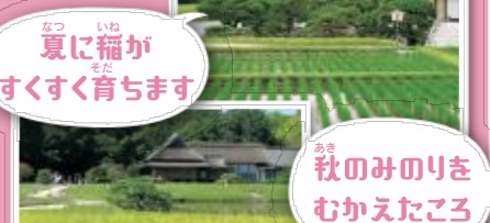
夏に稲がすくすく育ちます