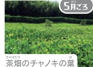
茶畑のチャノキの葉