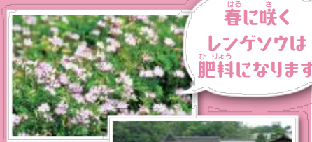
春に咲くレンゲツバは肥料になります

井田では、むかしながらの農業のようすを見ることができます。江戸時代は芝生よりも田畑がひろく、お殿さまたちも田植えを見していました。