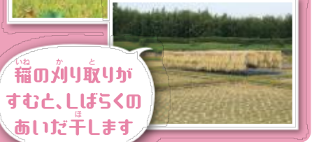
稲の刈り取りがすむと、しばらのあいだ干します