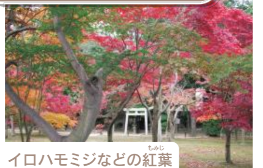
イロハモミジなどの紅葉