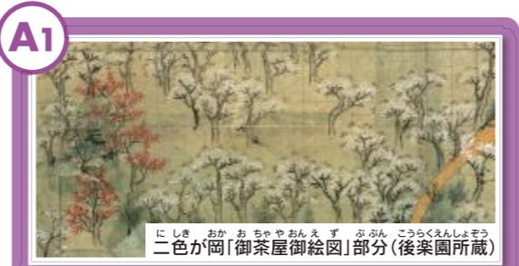
二色が岡「御茶屋御絵図」部分(後樂園所蔵)