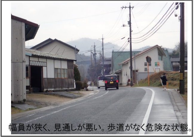
幅員が狭く、見通しが悪い。歩道がなく危険な状態。