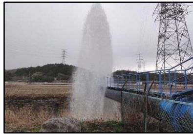
水管橋空気弁からの漏水(福島県)