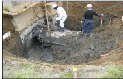
構造物接続部の配管離脱状況(茨城県)

★宮城、福島、茨城県などの臨海部に位置する工業用水道施設(場内・埋設管・水管橋)でも、揺れによる損傷、液状化、津波被害が発生した。