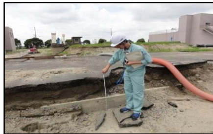
共同溝の不同沈下(茨城県)