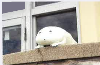
「最後は笑うことに決めた」2018(1分)