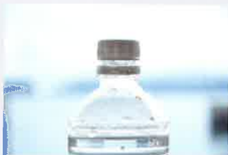
「あなたの呼吸のように」2018(2分)