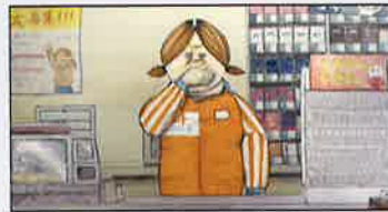
「おやすみ、コンビニ。」2018(2分)