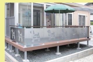
アルミニマル：フェンス