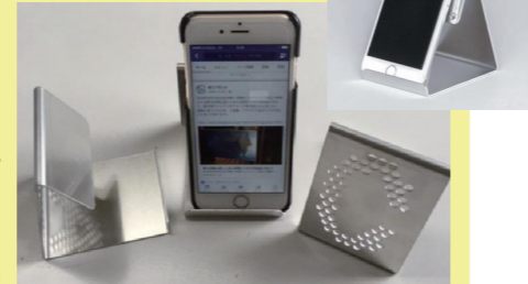
アルミニマル：スマホスタンド

学生の皆様には、アイデアやデザインを考える中で弊社やものづくりに関心を持っていただければ幸いです。