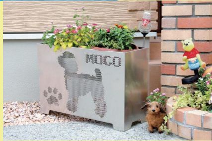
アルミニマル：プランターボックス

当社は大手自動車メーカーや農機具メーカーといった発注元メーカーからの下請けを中心に、自動車部品などの金属加工を行っています。当社で製造している部品は多種にわたり技術には自信はありますが、発注元メーカーの経営状況に左右されやすいのが課題であり、また、自動車などの製品の中に当社部品が埋もれてしまい、当社の技術力が広く伝わらないことも課題です。