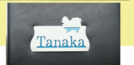
アニマル表札 (ボメラニアン)