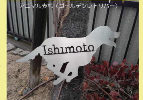
アニマル表札 (ゴールデンレトリバー)

一例としては、『光る表札』などがありますが、このような場合、どのように光らせるとよいか…といった観点でのアイデアをお待ちしています。