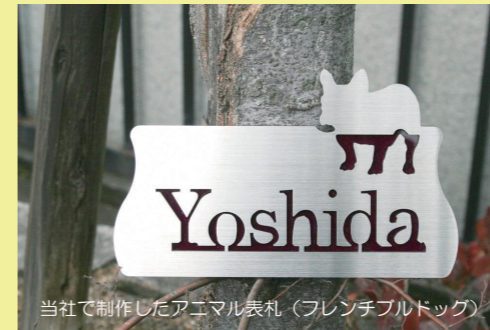
当社で制作したアニマル表札 (フレンチブルドッグ)

当社は産業用の機械器具 (コンベアやエレベーターなど) を製作しています。その製作過程に“材料の切断”がありますが、この切断の工程で「レーザー加工機」という鉄などを切断する機械を用います。当社が使用するレーザー加工機が大型のものであることから、その性質上、あまり細かいデザイン、形状、ディテールのものは加工できませんが、このページの写真に挙げた程度のものであれば製作することが可能で、実際に製品として販売しています。