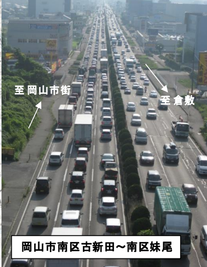
岡山市南区古新田