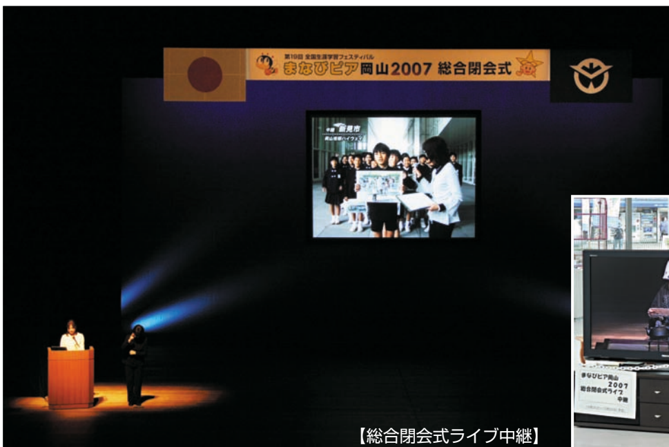
【総合閉会式ライブ中継】

「まなびピア岡山2007」は、大会史上初めて全市町村が参加して行われましたが、倉敷市芸文館で行われた総合閉会式では、鏡野町、新見市及び主会場と結び、各地で行われたフェスティバルの成果について、会場内のスクリーンに生中継で紹介しました。