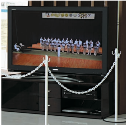
【ライブパーク倉敷のライブ映像】

本大会では、次世代インターネット規格であるIPv6マルチキャスト配信技術を活用し、独立行政法人情報通信研究機構の御協力のもと、次のとおり事業を実施しました。