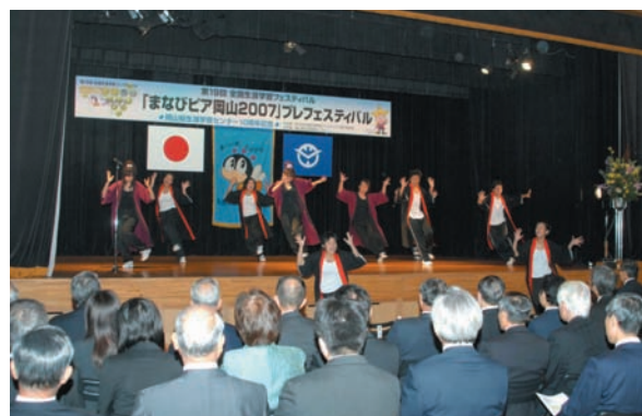
プレフェスティバル