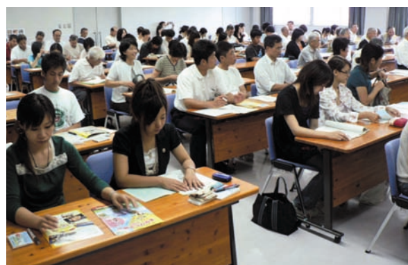
大会運営ボランティア基礎研修会