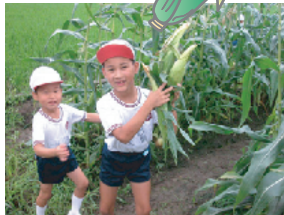
甘味が強いとうもろこし、親子体験教室にも使われています。