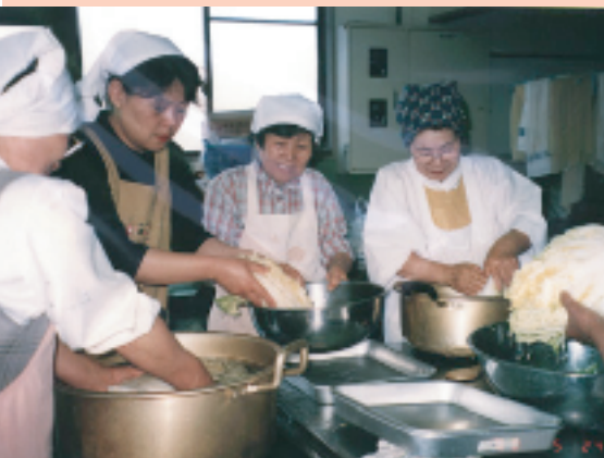
実習田で育てた野菜をみんなで楽しく料理しています。