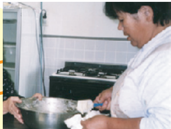
気の合う仲間同士でグループ活動に取り組んでいます。