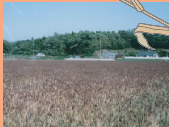
「麦を食べよう」をあいことばに栽培に取り組み、昔なつかしいおやつが再現されました。