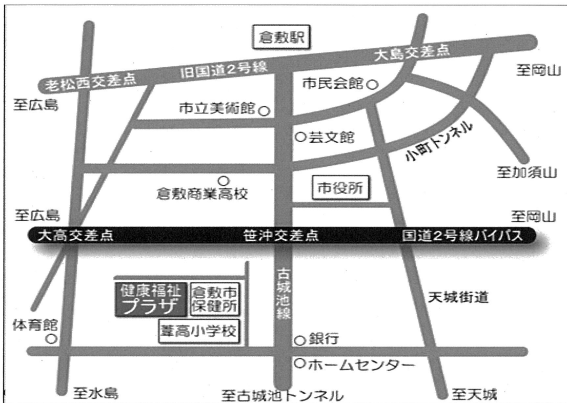
○暮らし健康福祉プラザ 案内図