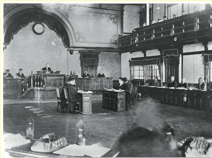
Okayama Prefectural Assembly Building and Assembly Hall (1909 - 1945)