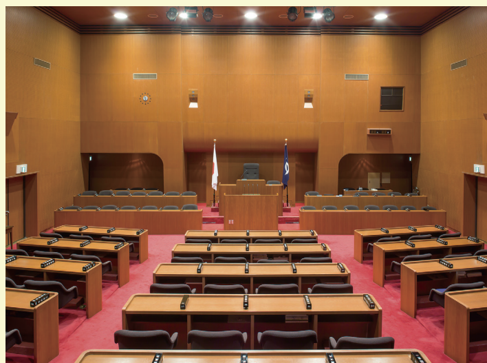
Okayama Prefectural Assembly Building and Assembly Hall (1957 - )