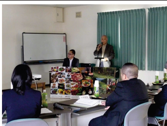
第2回審査委員会の様子（その2）