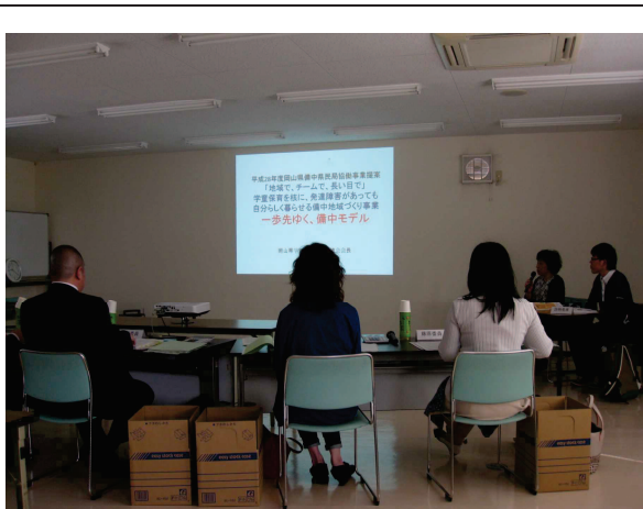
第1回審査委員会の様子（その1）

平成28年度協働事業提案募集制度により採択された9事業について、事業実施団体が結果報告プレゼンテーションを行い、審査委員会委員が講評等を行った。