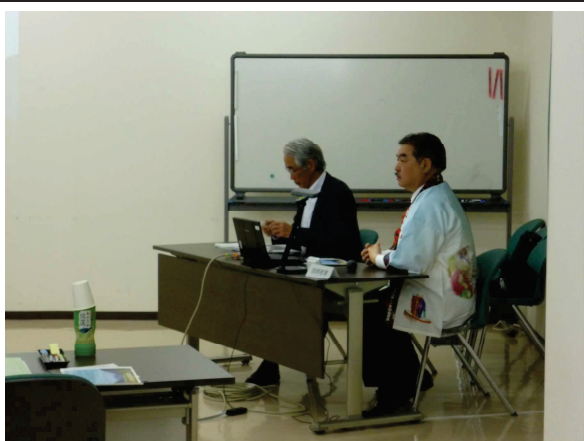
第2回審査委員会の様子（その1）