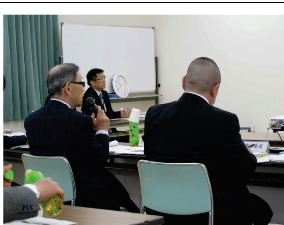
第1回審査委員会の様子（その2）