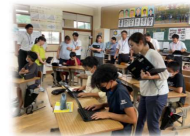
授業づくり支援（神目小学校）