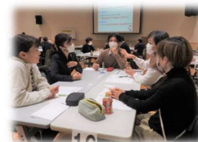
地域学校協働活動研修会 兼 人づくりまちづくり研修会