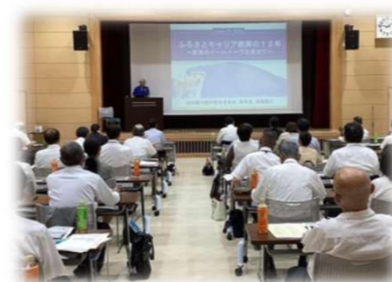
美作地区市町村教育委員会 連絡協議会研修会