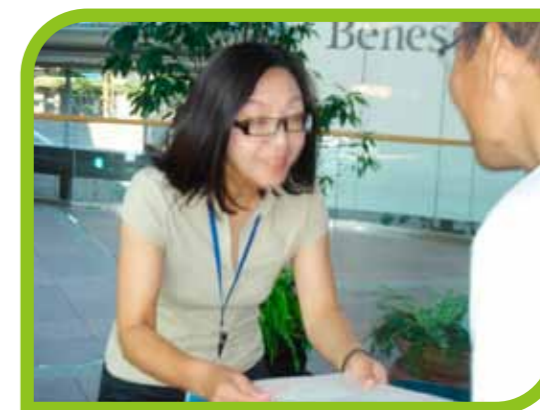
株式会社ベネッセビジネスメイト岡山営業所 様