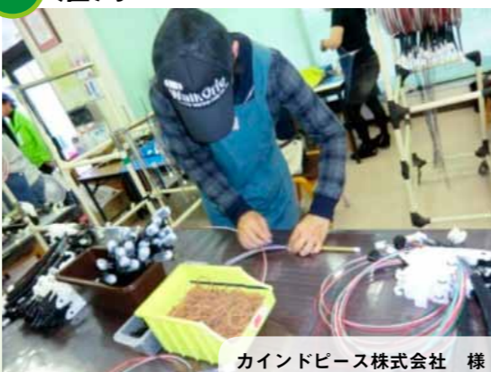
カインドピース株式会社 様

御協力いただける企業の皆様には、「岡山の就労応援団」登録証をお届けするとともに、岡山県教育庁特別支援教育課HPで「岡山の就労応援団登録企業」としてご紹介をさせていただきます。