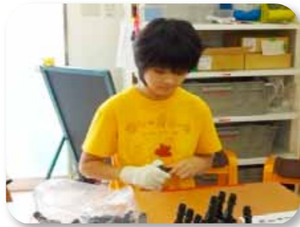
カインドピース株式会社 トライピース事業所 様