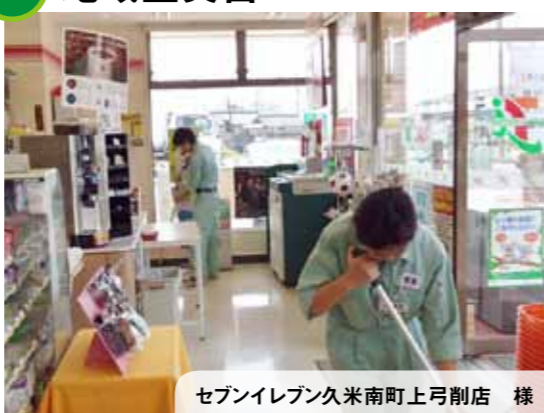
セブンイレブン久米南町上弓削店 様