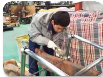
株式会社谷川工業 様