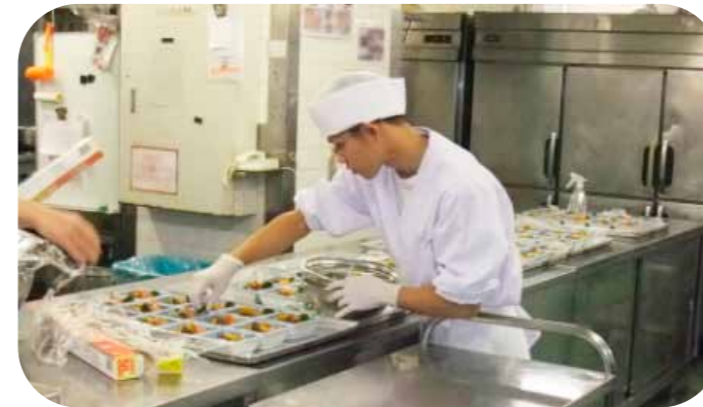
メルパルク岡山 様