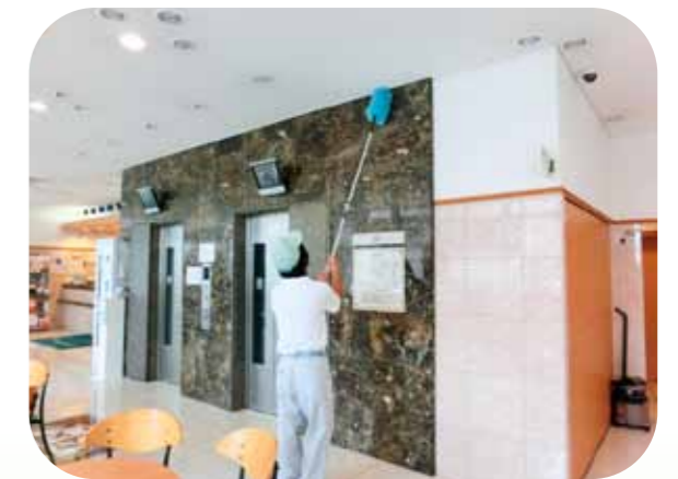
メ東横イン岡山駅西口広場 様