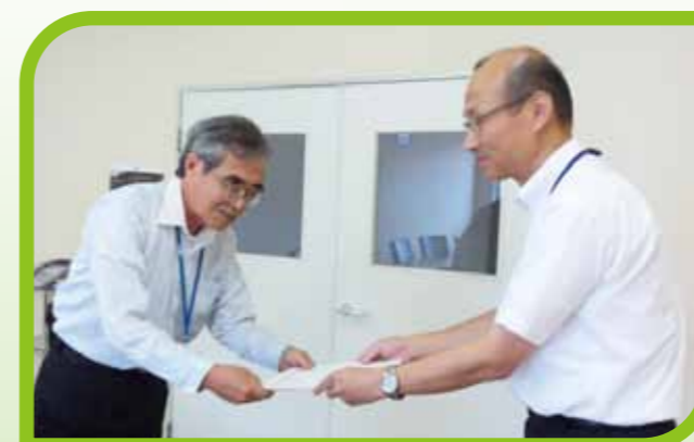
株式会社 トライ 様