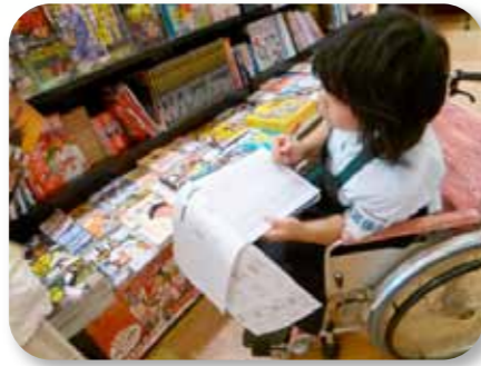
株式会社 ブックランドあきば 様