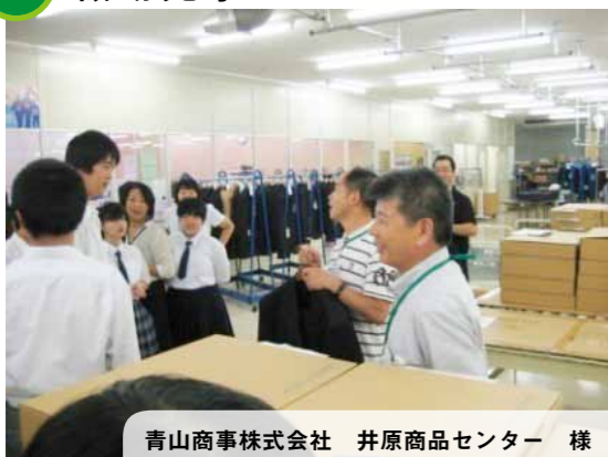
青山商事株式会社 井原商品センター 様