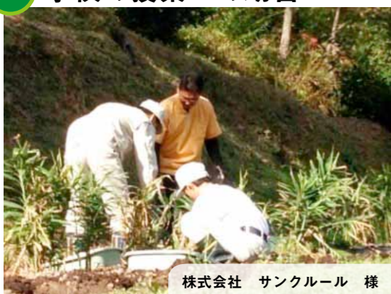
株式会社 サンクルール 様