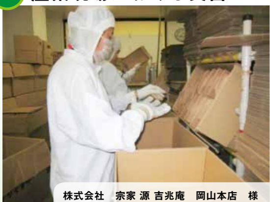
株式会社 宗家 源 吉兆庵 岡山本店 様