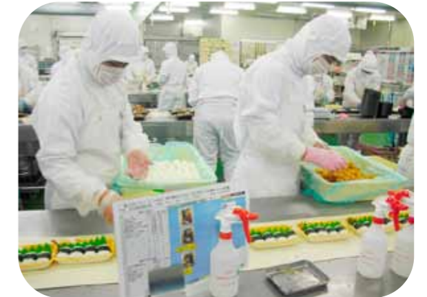
株式会社 できりか菜 様