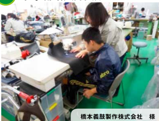
橋本義肢製作株式会社 様